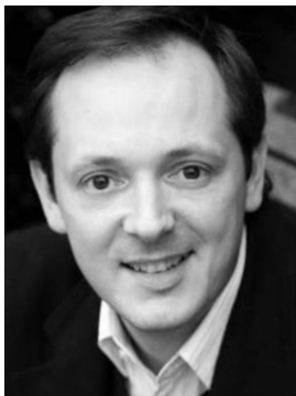
Robin Blaze